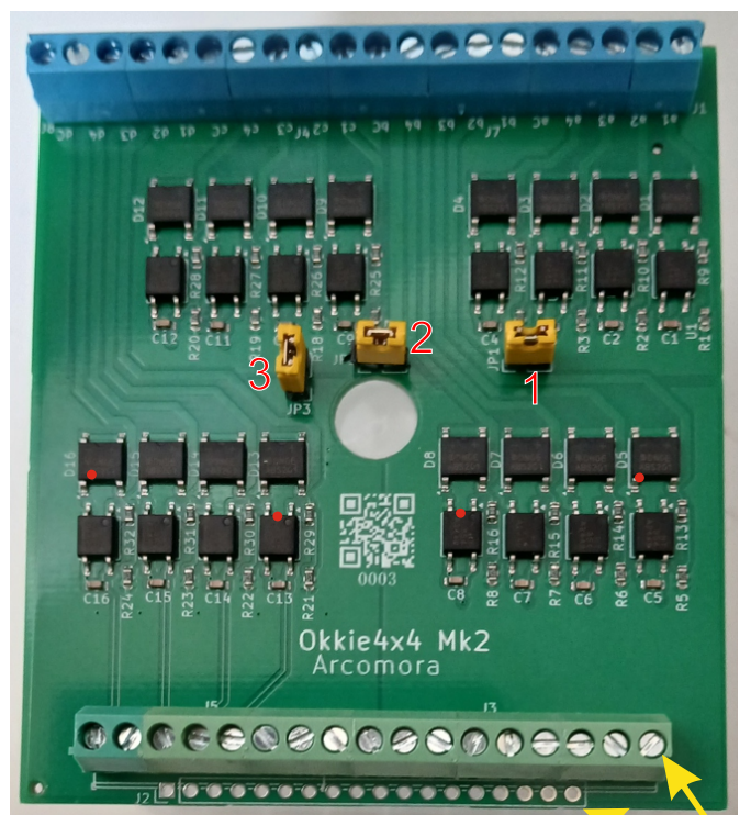
16 sorties vers LocoNext Toutes les bornes à vis ou 18 broches Dupont